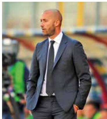
Cristian Bucchi, allenatore del Benevento dall'inizio di questa stagione